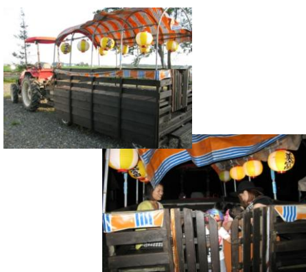
美富名物!? トラクター版幌馬車 (提灯に明かりもつきます... すごい!)

人数は少なくなっても、子どもを中心とした行事が、地域の絆づくりに役立つことを実践されていると感じました(セタまつりは、本会の町内会等活動支援事業を申請して行われました)。